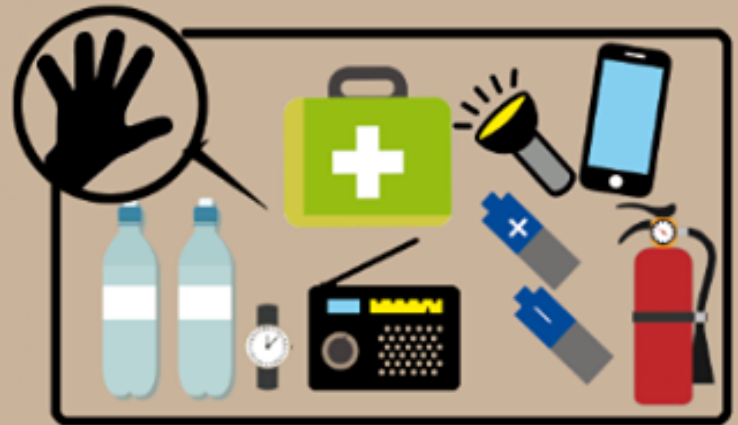
Kit sopravvivenza sempre a portata di mano